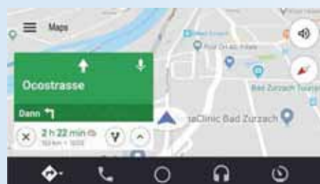
Navigation vom Smartphone