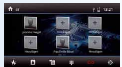
Freisprechfunktion mit Favoritenliste